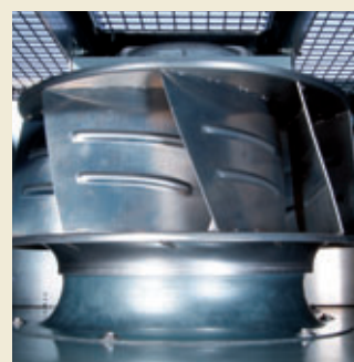
ЕС-вентилятор в обслуживании не нуждается