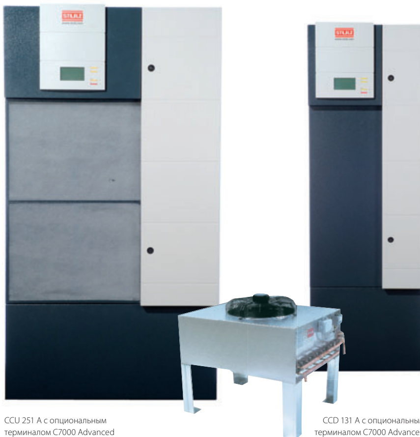
CCU 251 A с опциональным терминалом C7000 Advanced

В отличие от комфортных устройств кондиционирования воздуха, которые не рассчитаны на постоянный режим работы, MiniSpace с микропроцессорным управлением обеспечивает в точности заданные параметры окружающей среды с узким допуском при круглосуточной работе 365 дней в году.