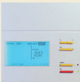
Пользовательский интерфейс C7000 Advanced

5) Конденсатор для блоков типа А с R407C, температура конденсации 45°C, окружающая температура: 32°C